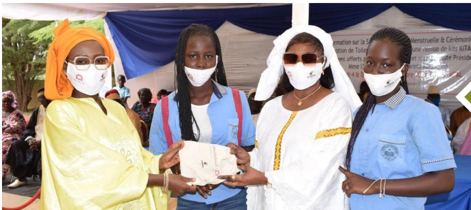
Kitambaa distribue des kits de serviettes hygiéniques aux jeunes filles du CEM de Mpal